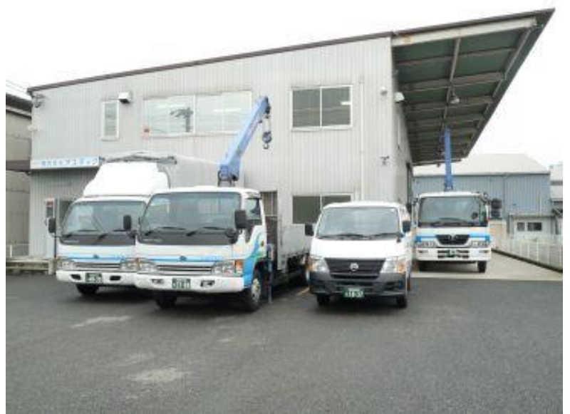
㈱アステック 会社案内図

株式会社モリタ 東洋自動機株式会社 森合精機株式会社 株式会社京都製作所グループ 日本フリーザー株式会社 ユニー株式会社グループ 株式会社愛工舎製作所 アンリツインフィーズ株式会社